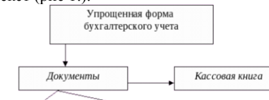
Рис. 1. Название рисунка