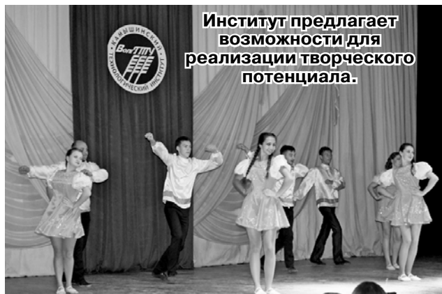
Институт предлагает возможности для реализации творческого потенциала.