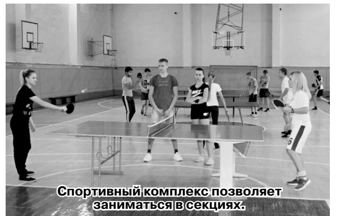
Спортивный комплекс позволяет заниматься в секциях.