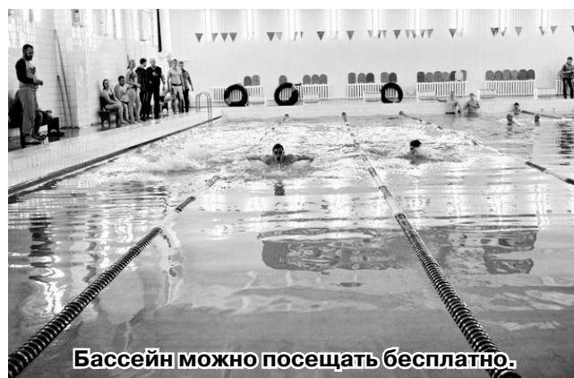
Бассейн можно посещать бесплатно.