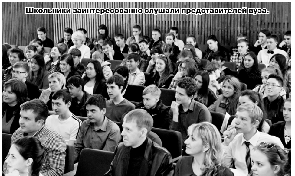
Школьники заинтересованно слушали представителей вуза.

За 20 лет своего существования институт подготовил